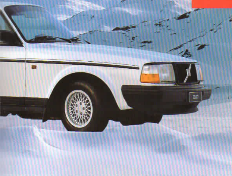
GL och SE.

93orna har nackkuddar fram och bak och blank grill som standard. GL-modellerna har dessutom klädsel av trikåplysch. Som extrautrustning finns nu också automatisk differentialspärr och freonfri luftkonditionering.