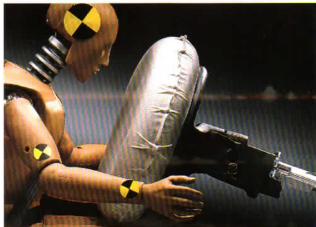
Airbag finns som fabriksmonterad extrautrustning för föraren.

I herrgårdsvagnens säkerhetsbur sitter föraren och passagerarna lika säkert som i sedanens.