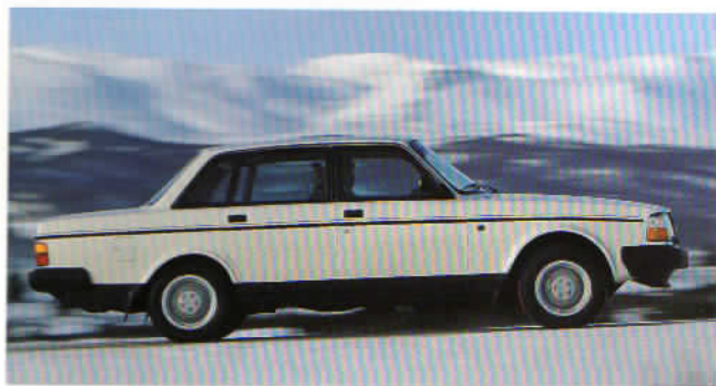
Bakom ratten gläds du åt den goda segdragningsförmågan, den exakta styrningen och det konsekventa uppträdandet.

Köregenskaperna är en av anledningarna. Styrsystemet och hjulupphängningen är konstruerade så att föraren slipper obehagliga överraskningar. Och i Volvo-stolens komfort kan koncentrationen hållas