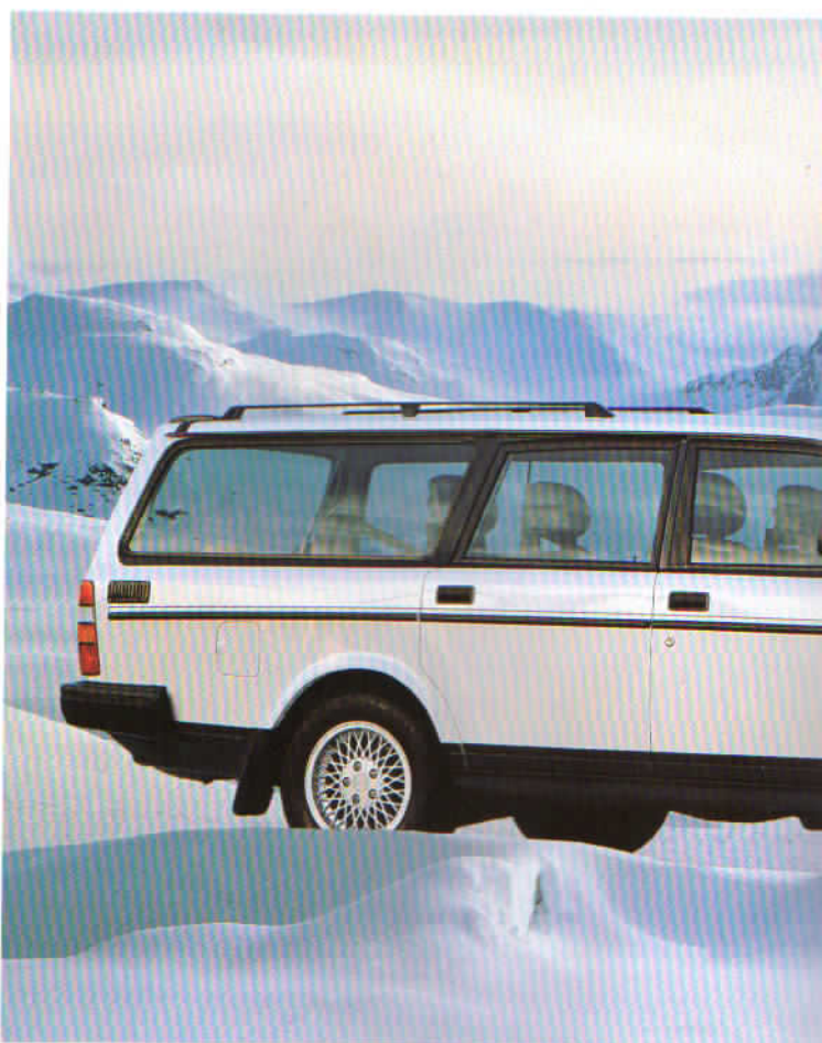
Både som sedan och som herrgårdsvagn finns Volvo 240 i två varianter.

Välkommen i klubben, du som prioriterar på samma sätt. Och välkommen att provköra den bil som förra året utsågs till "Bästa Köp" i den amerikanska konsumentguiden "The Complete Car Cost Guide".