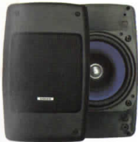
3340078-9/25 W. Enkelkonhögtalare. Passar i främre sidopanelen i samtliga modeller samt bagagehyllan på 4-dörrarsmodellerna.