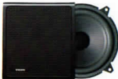
HT-222/40 W. Bashögtalare till främrdörr. Endast för 760 GLE 1988. Enkelkon.