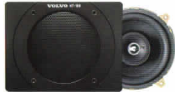
HT-169/40 W. Hatthyllehögtalare med djup bas. Koaxialhögtalare. Rekommenderas till ljudsystem med extra förstärkare.