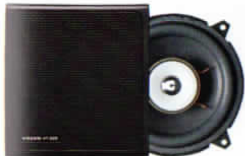
HT-225/30 W. Monteras i främrdörrarna. Koaxialhögtalare med stor magnet och spole för fylligare bas. Rekommenderas till ljudsystem med förstärkare.