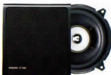
HT-224/30 W. Dörrhögtalare. Koaxialhögtalare.