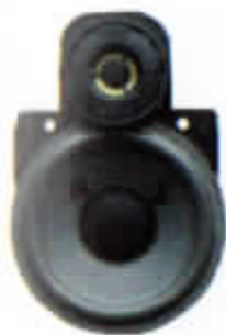
HT-221/25 W. Högtalare för instrumentbräda. Endast för 760 GLE 1988. Tvåvägssystem med dome diskant.