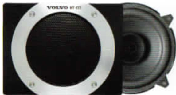
HT-172/25 W. Bakre högtalare. Dubbelkon.