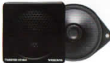
HT-164 Tweeter. Diskhögtalare monteras på instrumentbrädan. Rekommenderas till ljudsystem med extra förstärkare.