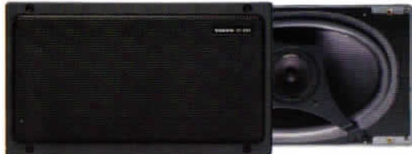
HT-237/40 W. 5 × 9" Koaxial hatthyllehögtalare. Högtalarboxen, som är öppen mot bagageutrymmet, är tillverkad i expanderad noryl. Rekommenderas till ljudsystem med extra förstärkare.