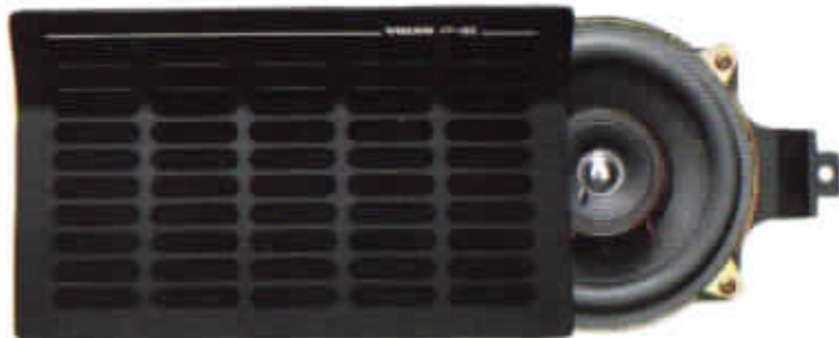
HT-182/40 W. Hatthyllehögtalare. Koaxial med basrör ger extra fylligt ljud. Rekommenderas till ljudsystem med extra förstärkare.