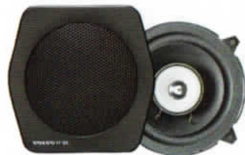
HT-205/30 W. Högtalare till framdörr. Koaxialhögtalare.