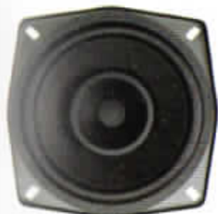
3433071-2/25 W. Dörrhögtalare. Dubbelkon. Skräddarsydd anpassning i förborrade hål.