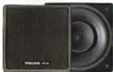
HT-174/30 W. Bakhögtalare till 245 dubbelkon.