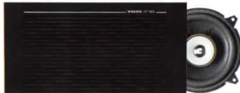
HT-183/30 W. Hatthyllehögtalare. Dubbelkon. Rekommenderas till ljudsystem med extra förstärkare.