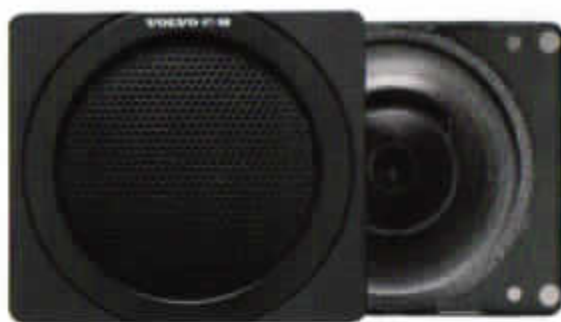
HT-168/30 W. Högtalare till framdörr. Dubbelkon.