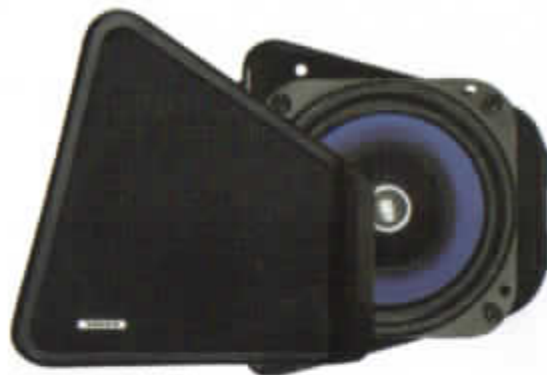
3340077-1/25 W. Dörrhögtalare. Dubbelkon.