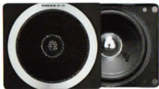
HT-173/20 W. Framdörrshögtalare. Enkelkon.