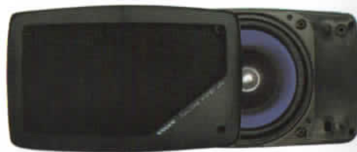
3340076-3/25 W. Enkelkonhögtalare. Monteras i bakre sidopanelerna. 3- och 5-dörrarsmodeller.