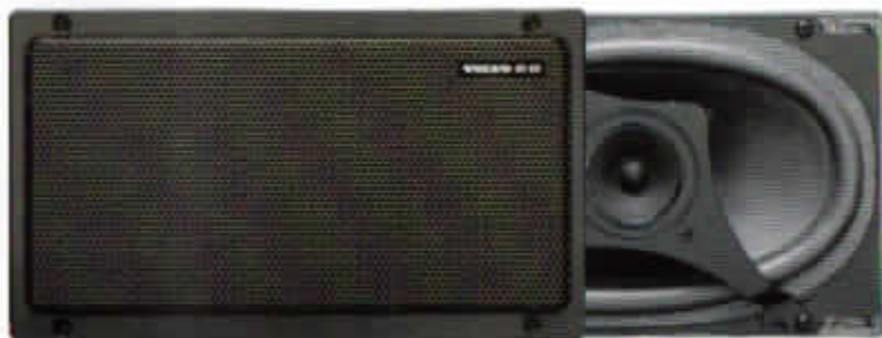
HT-217/40 W. 5 × 9" koaxial hatthyllehögtalare. Högtalarboxen, som är öppen mot bagageutrymmet, är tillverkad i expanderad noryl. Rekommenderas till ljudsystem med extra förstärkare.