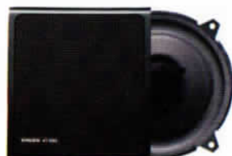
HT-223/25 W. Dörrhögtalare. Dubbelkon.