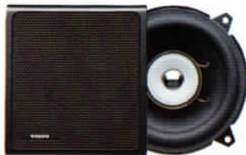
HT-226/30 W. Koaxialhögtalare till bakdörr. Endast för 760 GLE 1988.