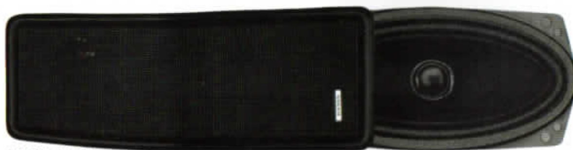
3433326-0/25 W. Tvåvägshögtalare för montering i bakre sidopanelerna.