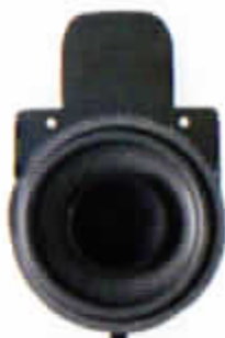
HT-220/25 W. Bredbandshögtalare för instrumentbräda. Endast för 760 GLE 1988. Dubbelkon.