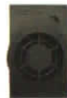
3433070-4/25 W. Diskanthögtalare. Monteras strax ovanför dörrhandtaget. Rekommenderas för ljudsystem med extra förstärkare.